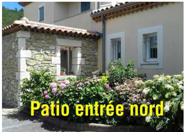
Patio entrée nord