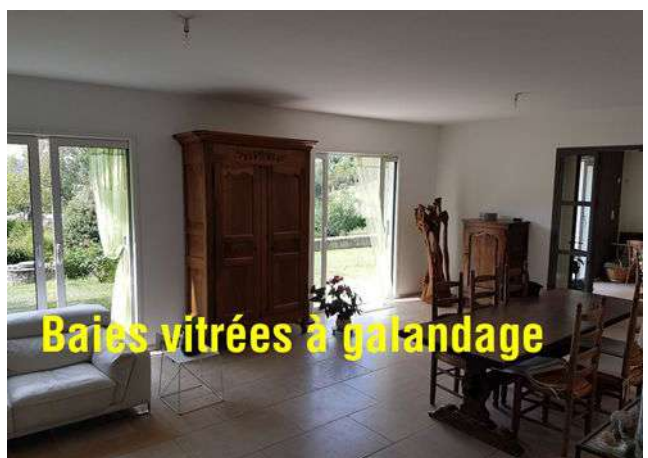
Baies vitrées à galandage