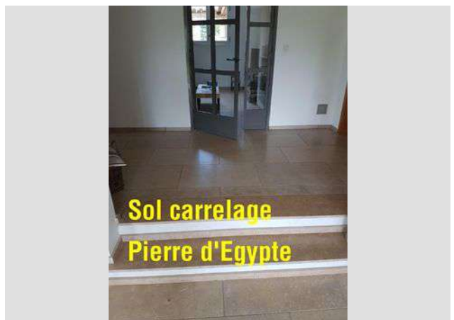
Sol carrelage Pierre d'Egypte